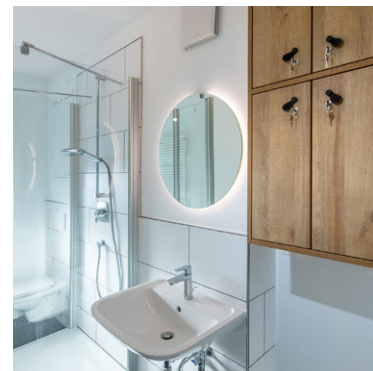
Fotos von unterschiedlichen Wohnungen der Semmel 16.